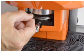
Insertion of a new gasket